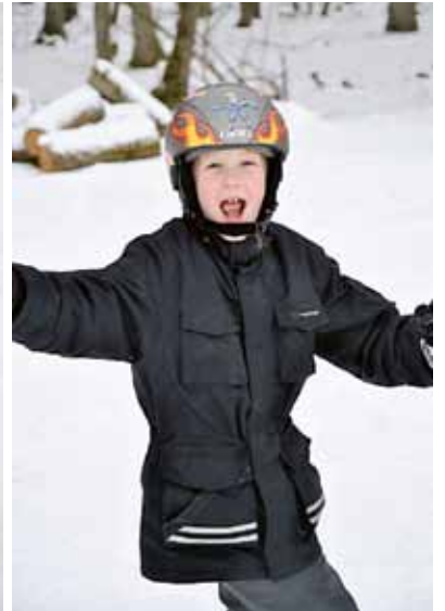
Hjälmen på. Sen är det bara att åka.