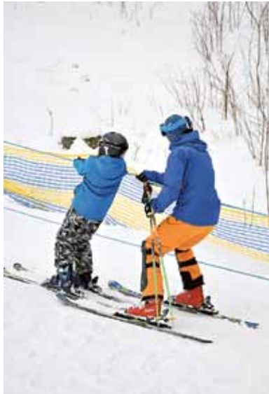
Åka utför är ingen match. Men man ska ta sig till toppen också.