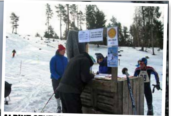
ALPINT CENTRUM. Sekretariat, tävlingscentral och kiosk. Allt får plats i en gammal äppellåda.