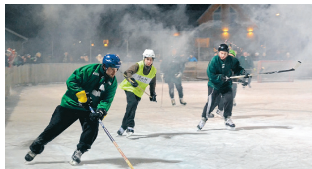
Grannbyarna Maglehem och Brösarp drabbade i fredags samman i ett hockeyderby på Österlen.

te vår uterink pratade med drömsk blick om sin hemstad – där finns fem konstfrusna isar spridda bland invånarna. Är det en slump att Peter Forsberg, Markus Näslund, Niklas Sundström, och tvillingarna Daniel and Henrik Sedin fostrats i denna miljö? Naturligtvis inte.