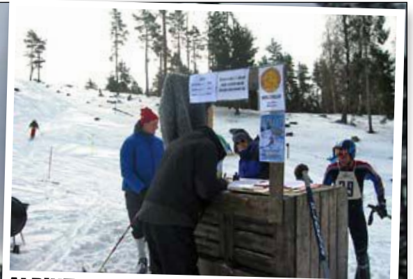
ALPINT CENTRUM. Sekretariat, tävlingscentral och kiosk. Allt får plats i en gammal äppellåda.