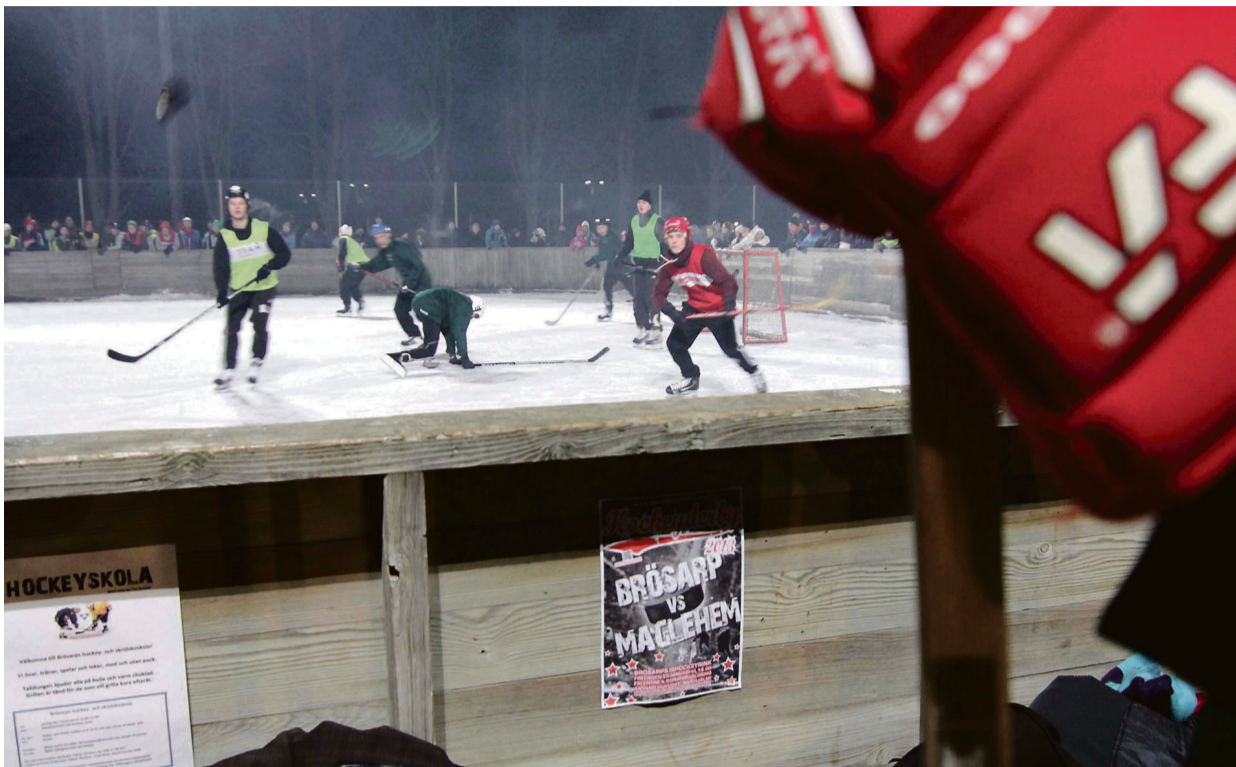
MÅNGA NYFIKNA bybor samlades kring uterinken i Brösarp när årets vinterklassiker avgjordes.

Även Tre Kronors förbundskapten Pär Mårts gästade byns ishockeyrink för att slå ett slag för hockey och konstrueringen i sydöstra Skåne.