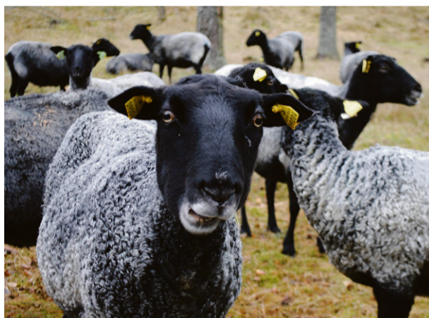
FÅREN SKÖTER ovetandes om skidbacken genom att hålla ner gräs och ljung med sitt betande.