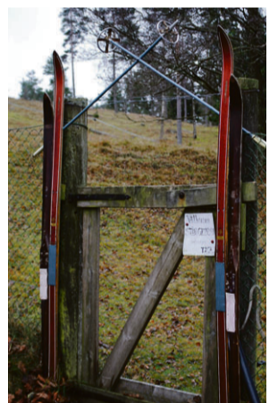
ÅRETS skidsäsong blir den tredje sedan Ornahögs nystart 2011.