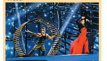
Krimborna ska rösta med övriga Ukraina i ESC. B1